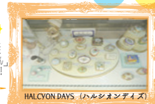
HALCYON DAYS (ハルシオンデイズ)

マッチ箱くまの大き目のイギリスの伝統工芸品です。実は日本の取り扱いには東京の銀座にある宝石店とモンビジュ SEIKODOの2店舗だけ。また「くまのアーマン」のデザインの商品は限定品なので日本ではここだけ！